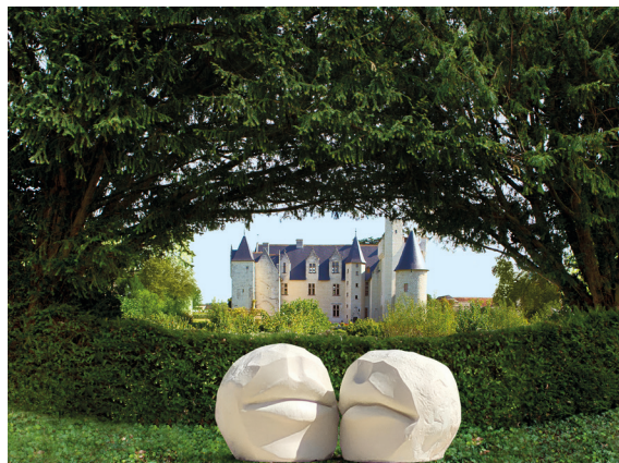
Le Kiss Laurent Pernot

Les jardins sont réputés pour leur poésie. Le Kiss , deux sculptures évoquant le baiser et l'amour complètent cette échappée vers le rêve